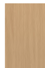
H834 Chêne clair