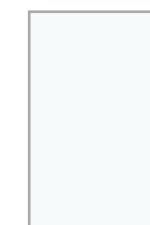
VK001 Bright White